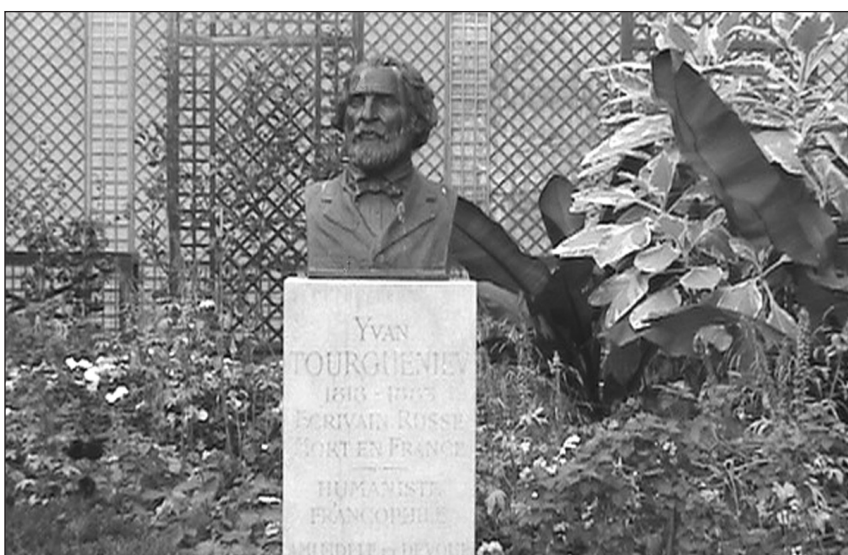
Бюст Тургенева. Скульптор Оганезов. 2003 г.

Выставка открыта до 10 ноября, с понедельника по субботу с 10.00 до 17.00 Выставочный зал «Aguado» 6, rue Drouot, Paris 9-e