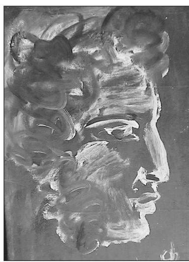
Ф. Константинов. Портрет Пушкина. 1913 г.

Представитель поколения шестидесятников Олег Лягачев